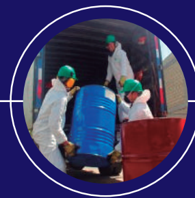
RECOLECCIÓN Y ALMACENAMIENTO